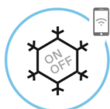
Aplikacija za daljinsko upravljanje