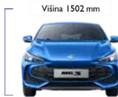
Višina 1502 mm