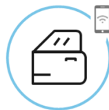
Zaklepanje in odklepanje vozila